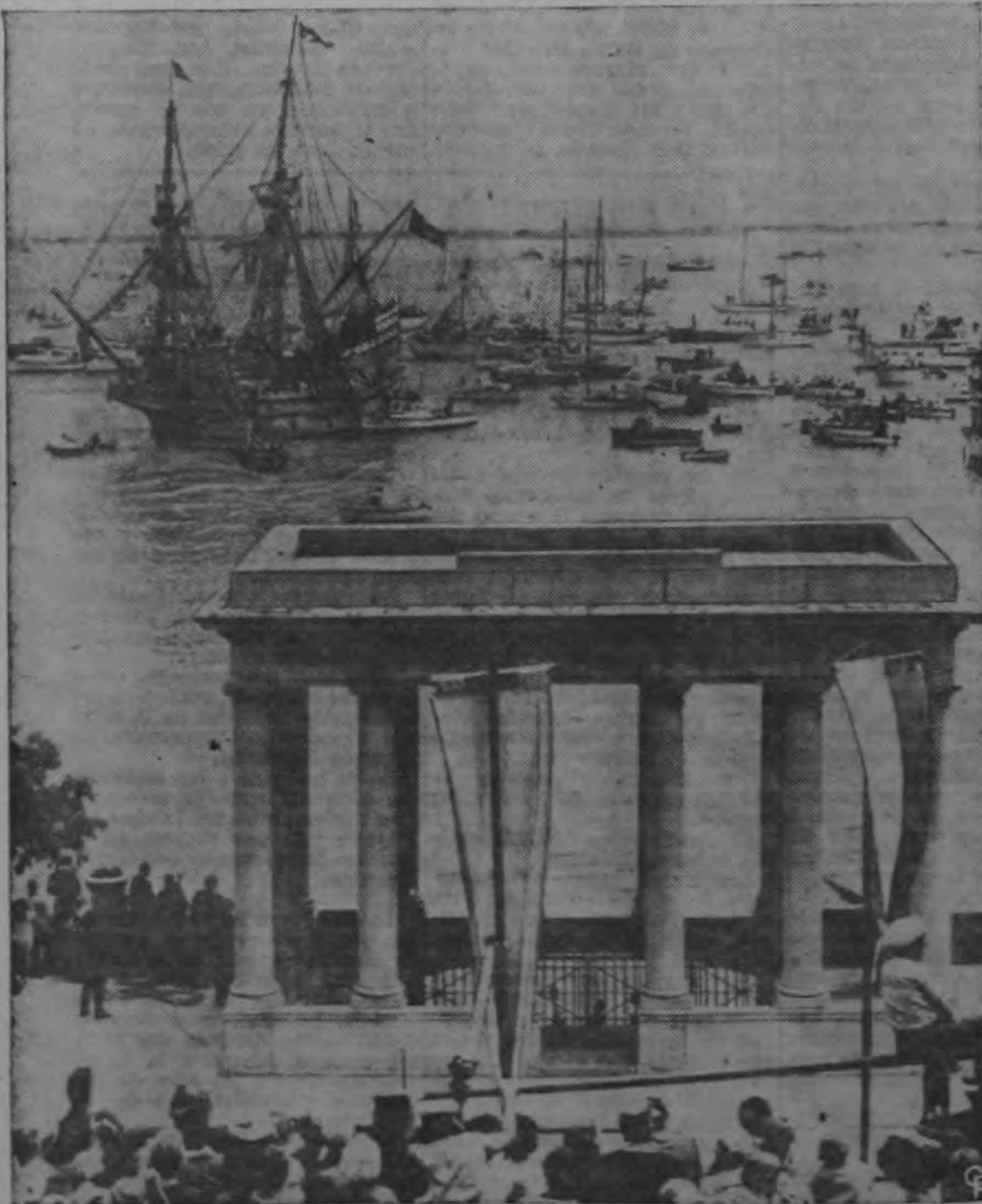
Al terminar su viaje de 53 días desde Inglaterra repitiendo el viaje de los Peregrinos en 1620. La Roca está colocada en un foso bajo la estructura conmemorativa que se ve en primer término. La embarcación menor es una chalupa, réplica de la embarcación que llevó a los peregrinos desde su nave a tierra en su desembarco en el nuevo mundo.