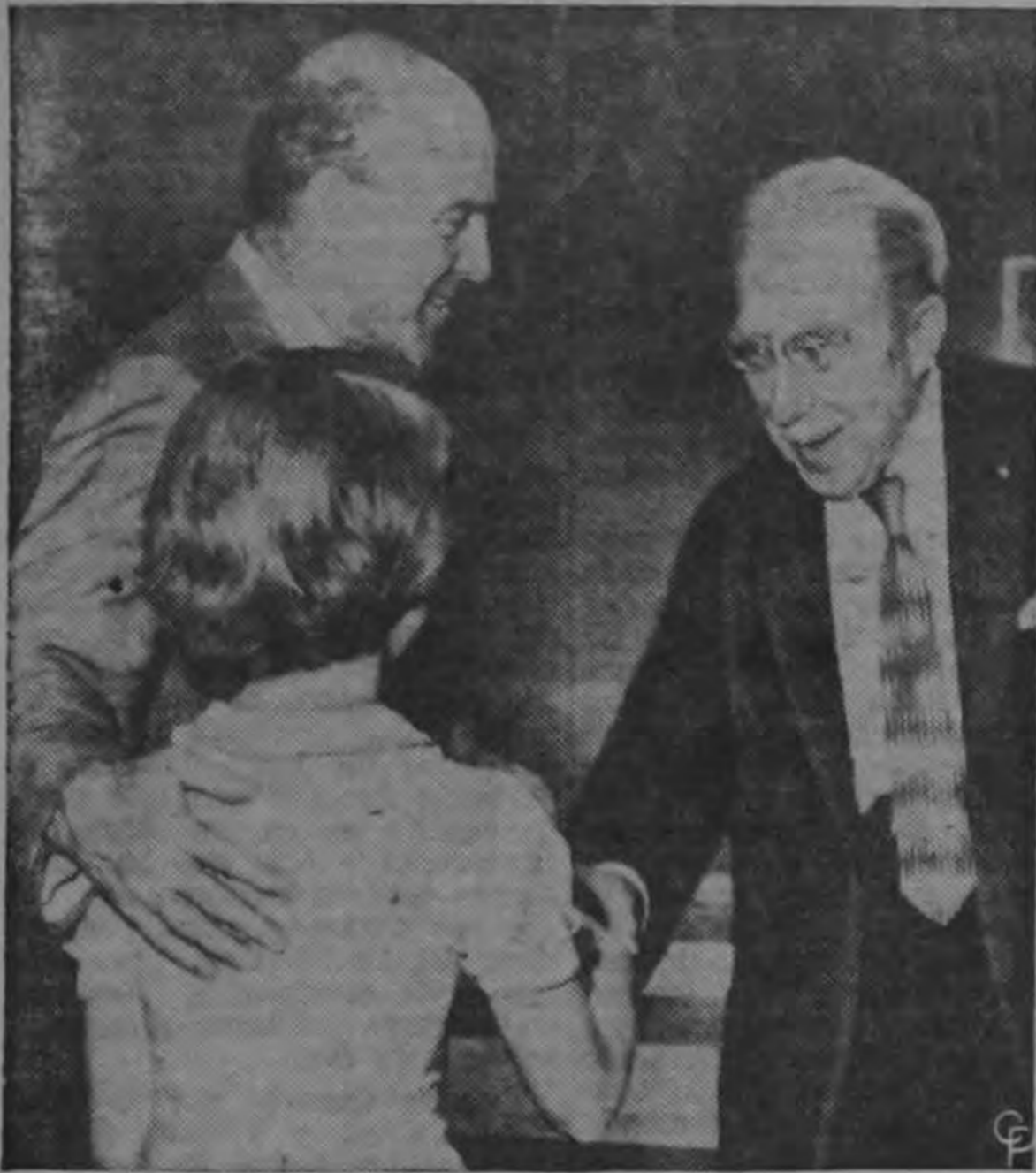
El Embajador británico Harold Caccia (Izquierda) presenta a su hija Antonia, de 10 años de edad, al Senador Theodore F. Green, demócrata por Rhode Island, de 89 años de edad, al llegar él a la recepción de la Embajada británica en Washington. La celebración fué en honor del 31 cumpleaños de la Reina Isabel II. Green es presidente de la Comisión de Relaciones Exteriores del Senado. INF