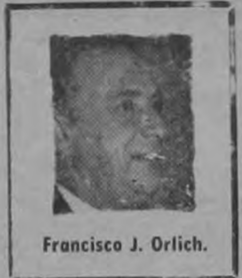
Francisco J. Orlich.

PRIMERA PUBLICACION: 27 DE MARZO DE 1957 SEGUNDA PUBLICACION: HOY