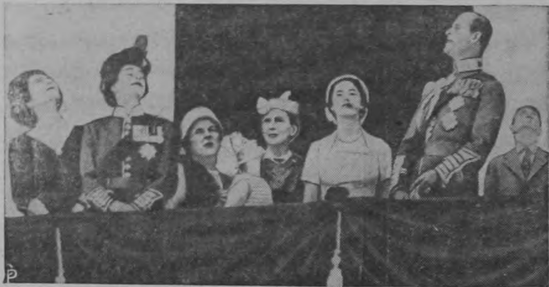
En el balcón del Palacio de Buckingham, en Londres, después de la pintoresca ceremonia del saludo a la bandera, la Reina Isabel II, se une a los otros miembros de la familia real para presenciar una exhibición de aviación que formó parte de las festividades con motivo de su 31 cumpleaños oficial. De izquierda a derecha: La Duquesa de Kent, la Reina Isabel II, una dama no identificada; la princesita Anne; la Duquesa de Gloucester; la Princesa Margarita; el Príncipe Felipe; el Príncipe Charles. El cumpleaños real fué el 21 de abril.